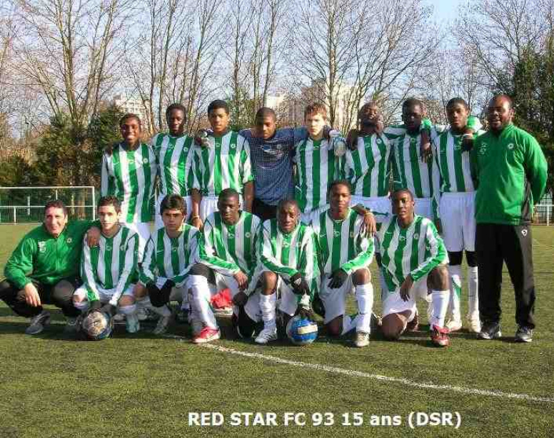
RED STAR FC 93 15 ans (DSR)

L'équipe dirigeante est composée d'entrepreneurs passionnés qui mettent leur expérience au service du Club. Leurs savoir-faire complémentaires, leurs compétences pluridisciplinaires associés à leur connaissance du milieu sportif et plus particulièrement du football, en font une équipe solide pour mener à bien le projet de reconstruction du RED STAR.